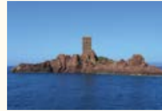
LES CALANQUES DE L'ESTÉREL