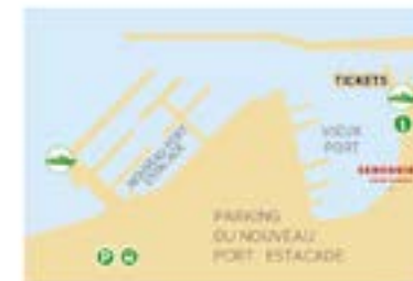
Saint-Tropez Vieux Port: Départs Sainte-Maxime, Baie des Canoubiers, Port Grimaud, Marines de Cogolin Nouveau Port: Départs pour les excursions, Les Issambres, Port Grimaud et Marines de Cogolin