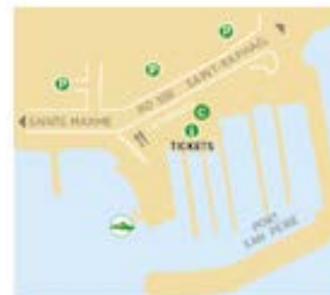
Les Issambres Départs excursions + Saint-Tropez