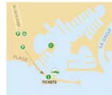
Les Marines de Cogolin Départs Saint-Tropez