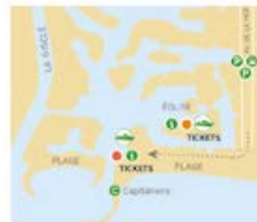
Port Grimaud Départs Saint-Tropez ● Capitainerie ● Eglise