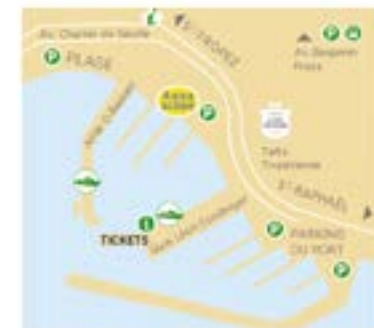
Sainte-Maxime Quai Léon Consolier: Départs navettes + Baie des Canoubiers Jetée Olivier Baumet: Départs excursions