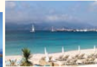
CANNES ÎLE STE-MARGUERITE