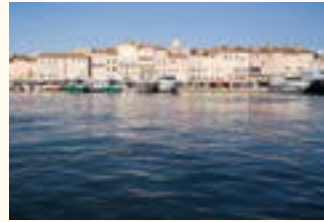
ST-TROPEZ SA BAIE & SES VILLAS CÉLÈBRES