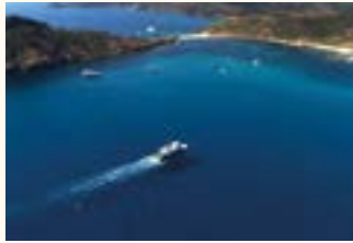
LES 3 CAPS CAMARAT, TAILLAT, LARDIER