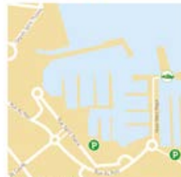
Cavalaire-sur-Mer Départs sortie naturaliste