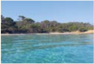
ÎLES PORQUEROLLES PORT-CROS

DEPUIS 1961 LA PLUS BELLE FAÇON DE DÉCOUVRIR SAINT-TROPEZ, SON GOLFE & LES CÔTES MÉDITERRANÉENNES